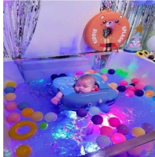
Gambar 1. Senam bayi (berenang)

Kegiatan penyuluhan ini merupakan salah satu media untuk menyampaikan informasi kesehatan, khususnya di daerah yang sulit dijangkau oleh media informasi konvensional, melalui peningkatan literasi informasi kesehatan. Penyuluhan yang dilaksanakan dimulai dengan pemberian materi, dilanjutkan dengan demonstrasi teknik pijat bayi yang benar ( baby massage ) dan senam bayi ( baby gym ). Setelah itu, dilakukan diskusi interaktif bersama masyarakat mengenai pengertian baby spa, manfaat perawatan baby spa , serta pemberian kesempatan kepada peserta untuk mempraktikkan secara langsung baby massage dan baby gym .