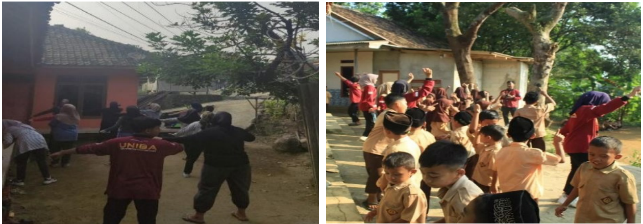
Gambar 1. Kegiatan senam bersama masyarakat di Lapangan Desa Ramea dan di Lapangan Sekolah