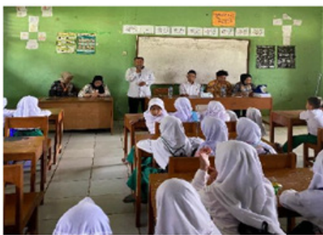
Gambar 1. Pengenalan ruang pojok baca kepada siswa MI Darul Huda

Program pengadaan pojok baca di MI Darul Huda, Desa Ramea, telah terlaksana dengan baik. Satu ruang yang ada di sekolah berhasil dilengkapi pojok baca dengan desain menarik dan koleksi awal sebanyak 150 buku bacaan anak, termasuk cerita rakyat, ensiklopedia mini, buku aktivitas, dan cerita bergambar. Kemudian siswa diperkenalkan terkait fungsi dan tata cara penggunaan pojok baca (Trisnawati et al., 2025), melalui kegiatan membaca bersama, bermain peran dari cerita, serta lomba membaca singkat untuk membangun antusiasme awal.