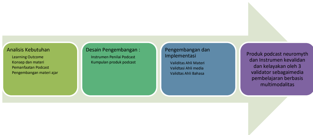
Gambar 2. Tahapan pelaksanaan kegiatan

Pada penelitian ini memiliki beberapa tahapan pelaksanaan kegiatan. Tahapan ini dilalui untuk menghasilkan podcast neuromyth dan instrumen tingkat kevalidan berdasarkan penilaian dari tiga validator untuk menjadikan produk ini sebagai media pembelajaran berbasis multimodalitas. Berikut pada Gambar 2 merupakan tahapan pelaksanaan kegiatan: